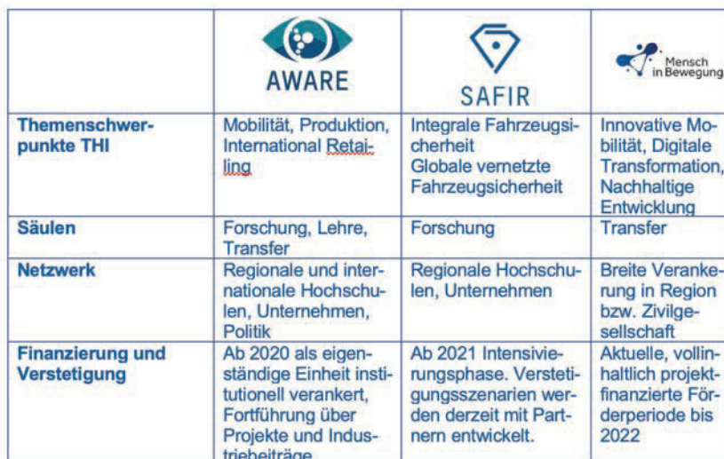
Tabelle 1: Strategische THI-Netzwerke mit der Keimzelle Mobilität und den großen gesellschaftlichen Herausforderungen als übergreifendes Leitthema

Antragstellung ist essenziell, dass der Antragsteller genügend Forschungserfahrung sowie Erfahrung im Projektmanagement mitbringt, um zu belegen, dass das Vorhaben umgesetzt werden kann. Perspektivisch erfolgte vor diesem Hintergrund die interne Erweiterung des Netzwerks durch die Einbindung neuer Kollegen, die wiederum zunehmend mehr Verantwortung übernahmen. Aufgrund der strategischen Bedeutung von SAFIR und MiB lag die Federführung beim MiB-Antrag sowie beim SAFIR-Strategieantrag jeweils beim Hochschulpräsidenten. Zudem leitet der Vizepräsident Forschung und Transfer diese beiden Netzwerkprojekte. Dem kommt entgegen, dass eine interdisziplinäre, überfachliche Qualifikation des Leiters dem Kerngedanken eines Netzwerkprojekts entspricht und von hohem Nutzen ist.